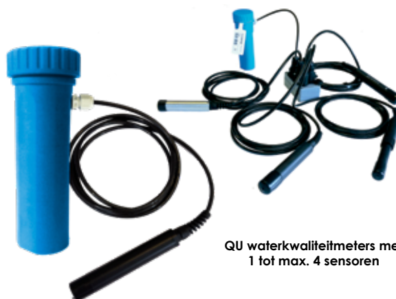
QU waterkwaliteitsmeters met 1 tot max. 4 sensoren